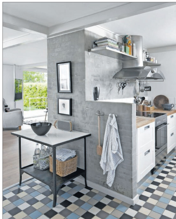
Køkkenet fik parret lavet i 2010. Gulvet er fra Evers lige som alle gangarealer i huset. Køkkenelementerne er bygget op i hvidt fra Lifa. Væggene er filsedet for at opnå et lidt råt udtryk. I forgrunden står et gasbord fra House Doctor.