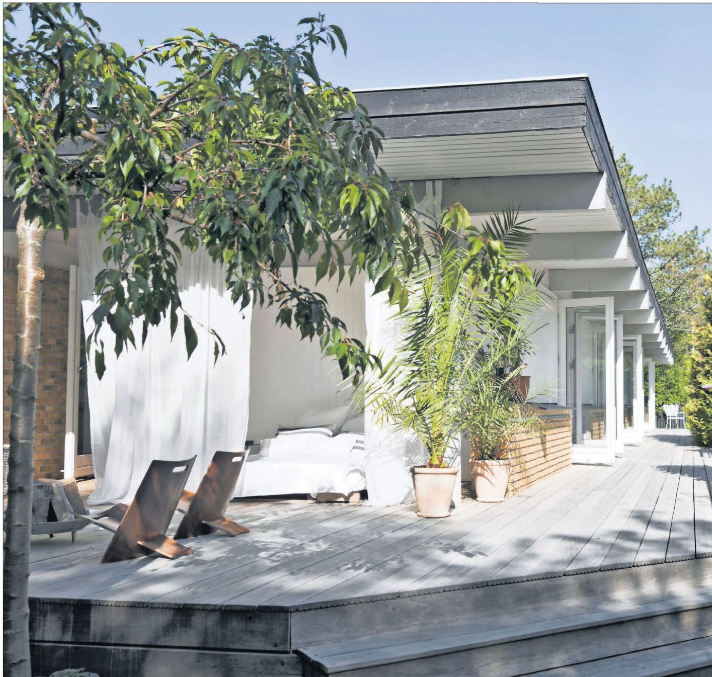
Fra alle husets værelser er der udgang til den lange terrasse. Her står alle døre åbne om sommeren, hvilket skaber en glidende overgang mellem inde og ude. Forrest er der indrettet en rummelig solseng og et lille ildsted til de lange sommeraftener.