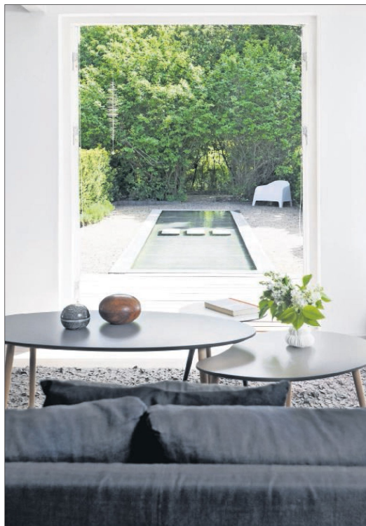
Udsigten fra sofaen midt i stuen. Her har parret anlagt et bassin – et roligt område både at se på og opholde sig i. Sofabordene er fra Via Copenhagen.

I stuen foran havedøren ser man familiens sofa i mørkeblå fra B&B Italia med pude fra By Nord. Lampen ved siden af er en La Lampe Gras, og bordene er fra Via Copenhagen. Gulvtæppet er fra Hay.