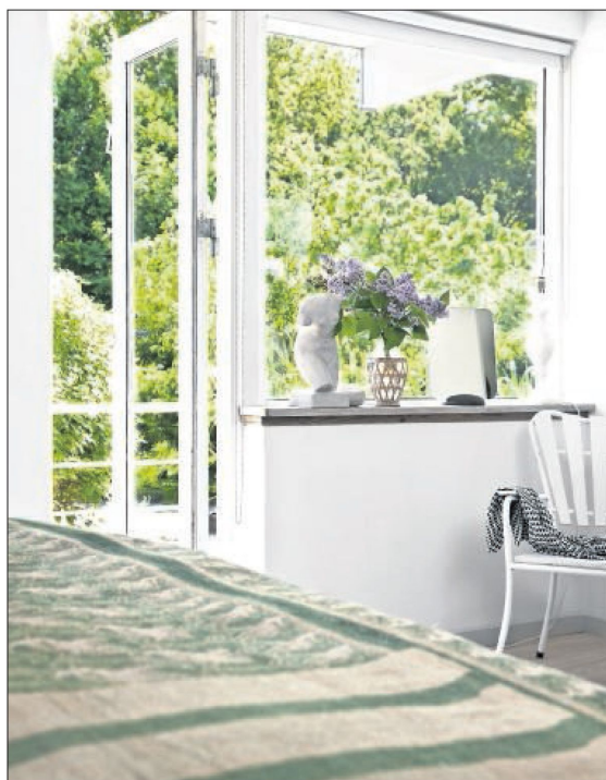
Fra soveværelset er der direkte udgang til den lange, smalle svalegang, der fører ned til familiens 2000 m 2 store have. Alt ender i en grøn skov, så ingen forstyrrelse fra naboer, men bare den rene, enkle natur.