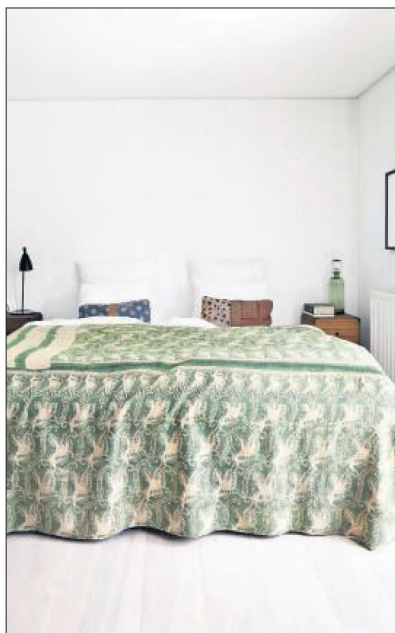
Parrets soveværelse er indrettet med dobbeltsengen som det centrale midtpunkt. Her er indisk sari lavet om til et sengetæppe og puder.