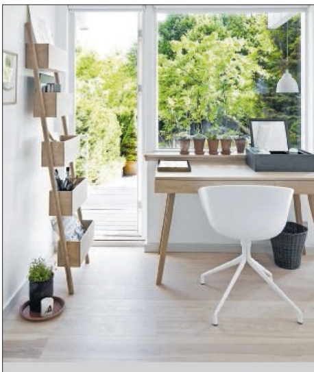
Datteren Carmens værelse, som fik en makeover i forbindelse med hendes blå mandag, hvor der blev lavet en forvandling på baggrund af hendes egne ønsker, imens hun var væk.